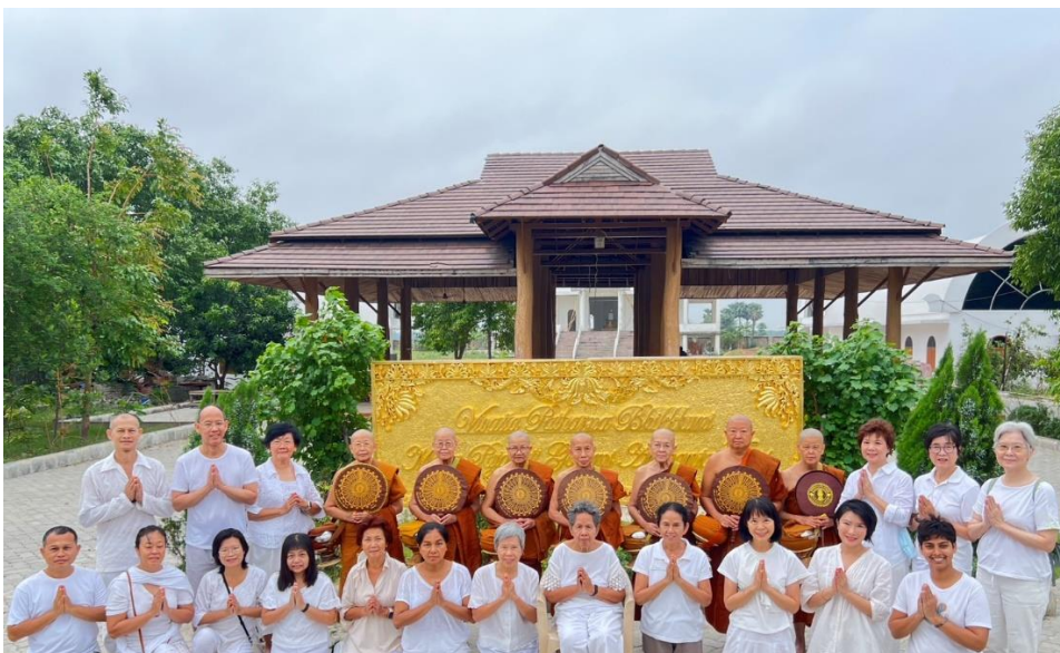
วิวิฎฐปฐมภิกขุณีมหาปชาปตีโคตมอรหันตเถริชยันตี ๒๖๐๐ เมืองเวสาลี พุทธภูมิ