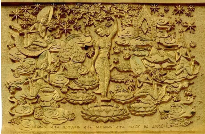
ประสูติ ใต้ต้นมหาสาละ ลุมพินีวัน

ซึ่งเป็นคำสั่งสอนพระพุทธเจ้า เรียกว่า “วิตกวิจารณ์พุทธวจนะ” จึงจะรู้เข้าใจและตรัสรู้ได้ เราชาวพุทธจึงต้องฟัง จดจำ และรู้ตามพระพุทธองค์เท่านั้น