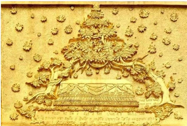
ปรินิพพาน ใต้ต้นมหาสาละคู่ กุสินารา

ปรมัตถอนุตรสัมมาสัมโพธิทรงตรัสรู้และสั่งสอนพุทธสาวก ตลอดเวลา ๔๕ วัสสา (ปี) ในเวลาปีหนึ่งมี ๑๒ เดือน ภิกขุ ภิกขุณีจะเข้าวัสสาเพียงสามเดือน เริ่มเข้าวันแรม ๑ ค่ำ เดือน ๘ จนถึงวันขึ้น ๑๕ ค่ำ เดือน ๑๑ และจะเริ่มถวายผ้ากฐินได้ในเวลา ๑ เดือนตั้งแต่วันแรม ๑ ค่ำ เดือน ๑๑ ถึงวันขึ้น ๑๕ ค่ำ เดือน ๑๒ เท่านั้น ในวัสสาที่ ๔๕ ก่อนเสด็จดับขันธปรินิพพานในวันขึ้น ๑๕ ค่ำ เดือน ๖ ทรงปลงพระชนมายุสังขาร ณ ปาวาเจตียะ เมืองเวสาลี ว่าอีก ๓ เดือนข้างหน้าจะทรงเสด็จดับขันธปรินิพพาน ณ เมืองกุสินารา ใต้ต้นมหาสาละคู่ (ความสำคัญประการที่ ๓) ได้ทรงตอบคำถามพระมหากานท์ว่า จะทรงตั้งพระธัมมวินัย ๘๔,๐๐๐ ธัมมขันธ์ เป็นองค์แทนหลังทรงเสด็จดับขันธปรินิพพาน ว่า “โยโว อานันท มยา ธัมโม จะ วินโย จะ เทสิโต ปัญญูติโต โสโว มมังจะ เยนะ สัตถา” เราชาวพุทธจึงต้องยึดคำสั่งสอนในพระไตรปิฎกมากกว่าไปเชื่อคำสอนของพ่อแม่ครูบาอาจารย์ที่สอนผิดเพี้ยนไปมากในยุคปัจจุบัน ที่เรียกกันว่า สายมูเตลู ไปบูชารูปเคารพมากกว่าไปรู้คำสั่งสอนที่ลึกซึ้ง